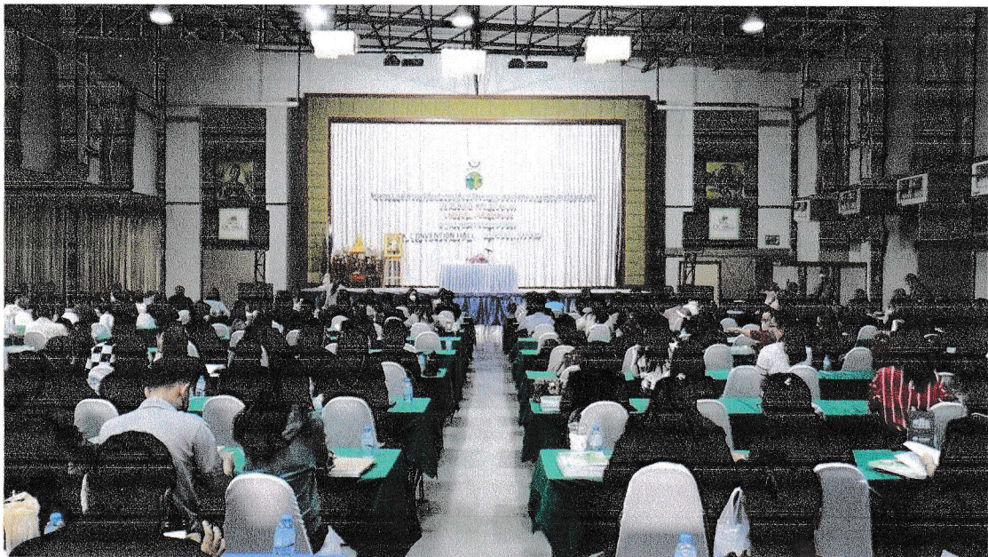
/การแต่งตั้ง...